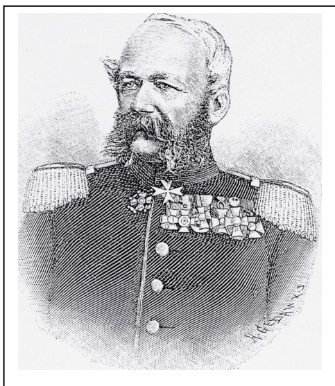
Le général Bruno von François

Inscriptions : Face Nord : Hier fiel am 6. August 1870, A. 4, General Bruno von François