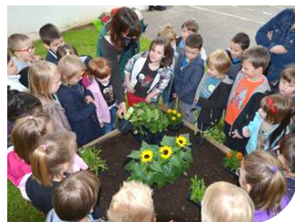
Ecoles Page 3