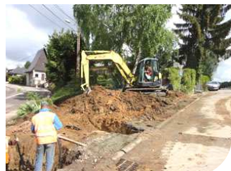
Travaux Page 2