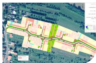
Urbanisme Page 4